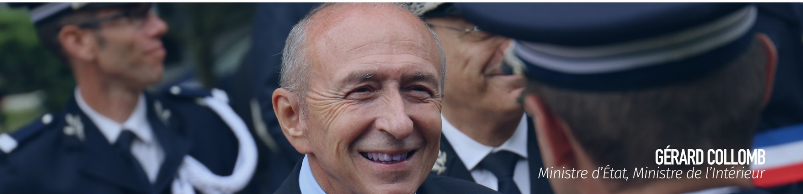
GÉRARD COLLOMB Ministre d'État, Ministre de l'Intérieur

“ La Police de sécurité du quotidien, c'est une méthode et cinq priorités ”